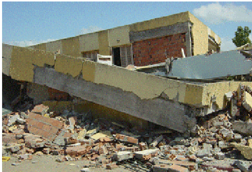
Séisme du 21 mai 2003 : Aperçu des dégâts engendrés par le séisme du 21 mai 2003.